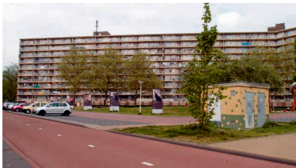
Jan van Beierenflat

Heeft u een eigen bedrijf en bent u op zoek naar een kantoor- en/of ontvangstruimte in de buurt? In de flat aan de Jan van Beierenlaan zit een aantal bedrijfsruimten. Op dit moment staan er twee ruimten te huur.