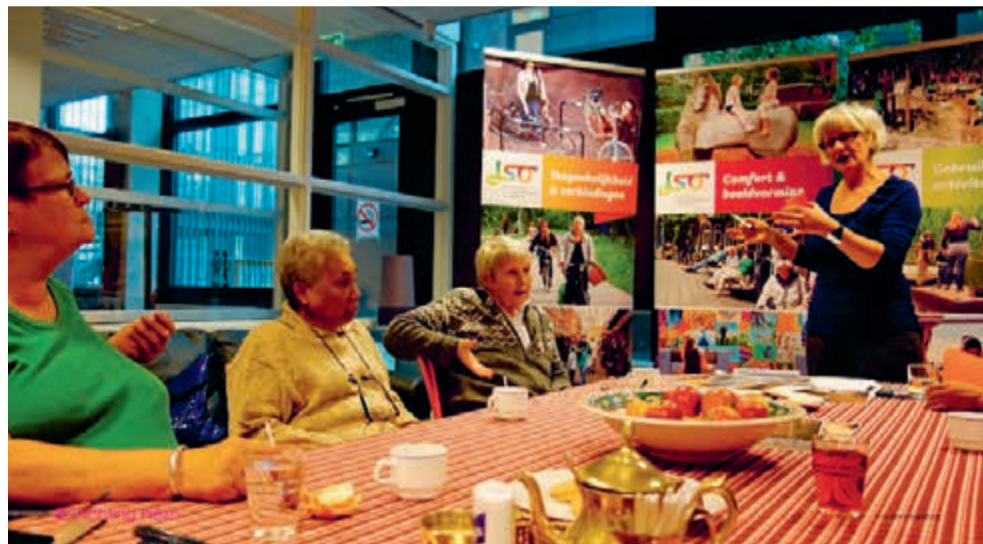
Aan de slag met Placemaking

Eind vorig jaar gingen organisaties en wijkbewoners aan de slag in het gebouw. Ze beoordeelden de verschillende ruimtes en gaven allerlei ideeën om het pand aantrekkelijker te maken.