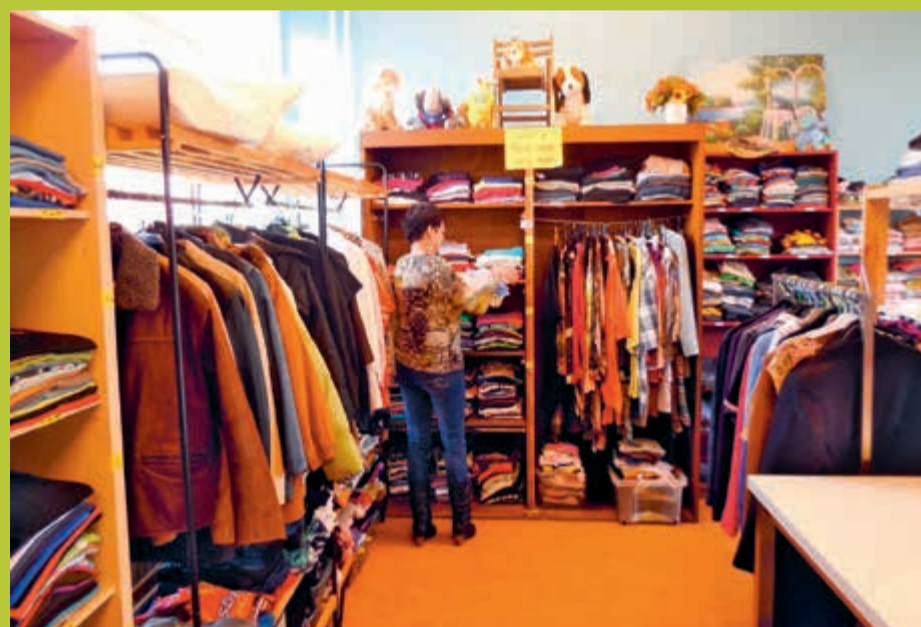
Kasten vol met goede kleding bij MEVE

Kledingbank MEVE in Palenstein is geopend van maandag t/m donderdag van 9 tot 3 uur.