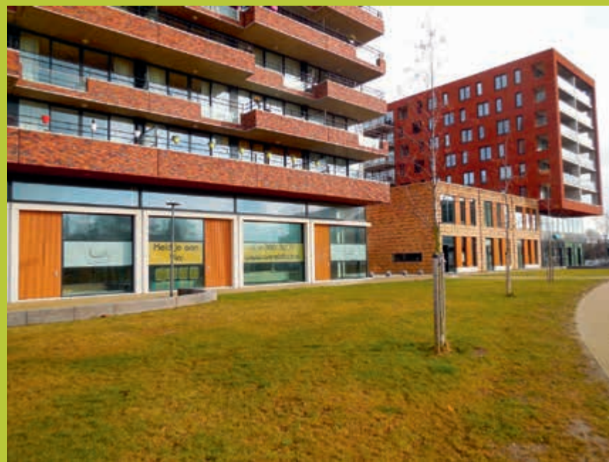
In april opent De Wereldlach haar deuren

De nieuwe ondernemers zijn Mizu Wellness, kapsalon Fresh Cuts Barbershop, Orthodontistenpraktijk De Wereldlach en Het Lasercentrum. Het gezondheidscentrum Palenstein en de zonnestudio Beautysun waren al in Schoutenhoek gevestigd.