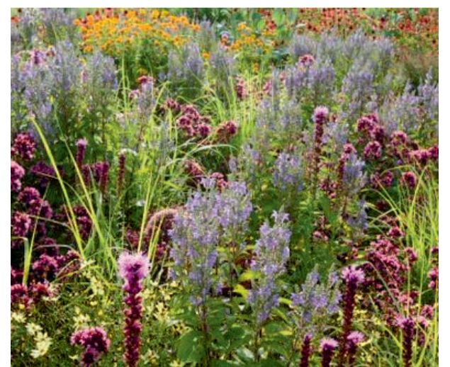
Voorbeeld van een prairietuin in de zomer!

De planten en grassen in een prairietuin moeten vechten voor hun plekje en onderdrukken veel onkruid. Ze gaan met hun wortels flink de diepte in en kunnen daardoor goed overleven. Dat levert een duurzame tuin op die vele jaren meegaat. Bovendien trekt de beplanting vlinders, bijen en andere insecten aan. Dat belooft wat voor de toekomst!