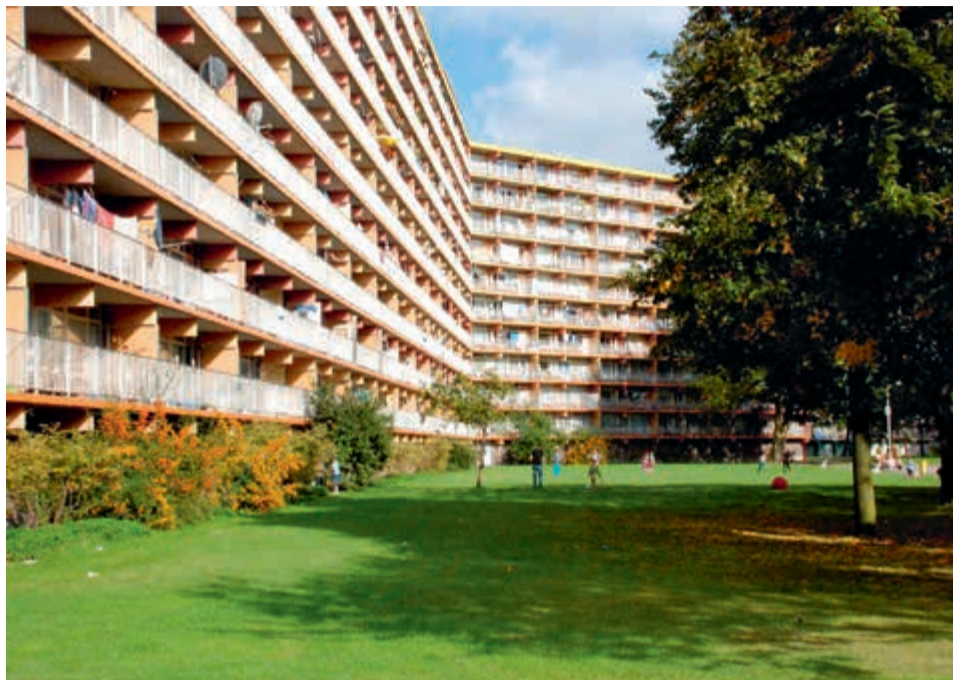
Florens van Brederodeflat