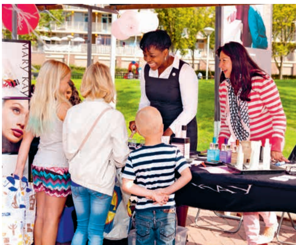
Organiseer nu je eigen buurtfeest!

We zien veel verhuisdozen in de flat aan de Florens van Brederodelaan. En ook in de flat aan de Jan van Beierenlaan zijn de eerste dozen gespot. Kortom, er wordt flink verhuisd in deze twee flats.